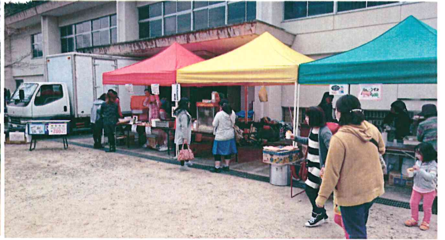
体育館横の販売コーナーブース