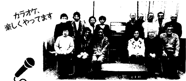
カラオケ、 楽しくやっています