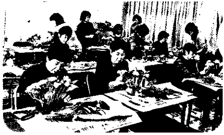
いい香りの花 どう生けたら いいかしら。