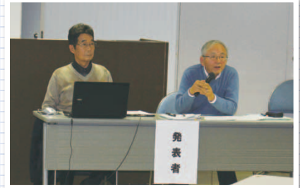
「第1次福祉のまちづくりプラン策定の現状と課題」 矢賀学区社会福祉協議会