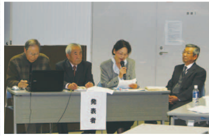
「見守り活動とサロンの活性化」 戸坂城山学区社会福祉協議会