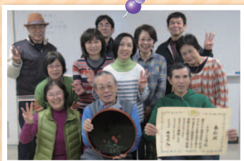
わ 3本指は手話で「Wa」の表現