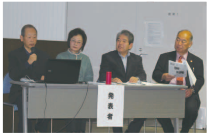
「広報とサロンできづく福祉の絆」 福田地区社会福祉協議会