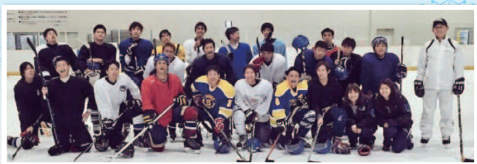
「わたしたちと一緒に楽しく滑りましょう!」 修道大学アイスホッケー部と仲間達

ボランティア募集・講座・イベント情報などの新着情報はホームページをご覧ください。 アドレス http://www.shakyo-hiroshima.jp/higashi/