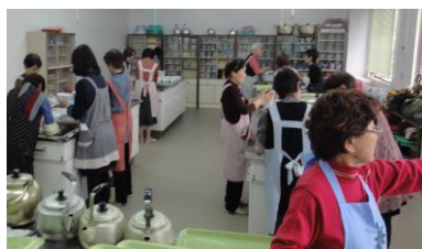
キッチンには戦場