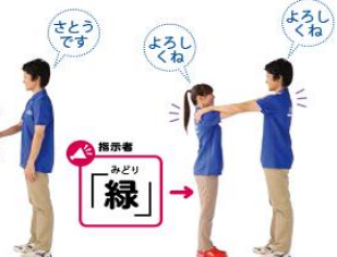
3 3の動作をしながら、「よろしくね」と言う。