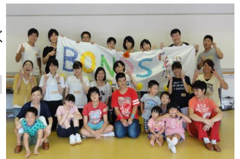
みんなで横断幕作ったよ