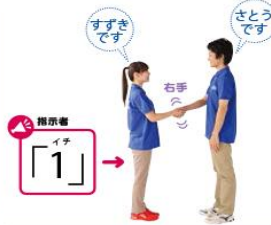
1 1の動作をしながら、自分の名前を言う。

やり方 名前や挨拶を言いながら行いましょう 私が「1」と言ったら、右手で左手しながら自分の名前を言います。「2」は左手で右手しながら相手の名前を言います。「3」は相手の両肩を触りながら「よろしくね」、「4」は両手でハイタッチしながら「イエイ!」と言います。 ●3～5回行います