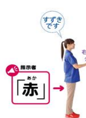
2 2の動作をしながら、自分の名前を言う。