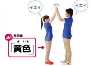
1 1の動作をしながら、「イエイ」と言う。

やり方 色で指示をします 数字を色に変えて指示を言います。「赤」は右手で左手しながら自分の名前を言います。「青」は左手で右手しながら相手の名前を言います。「緑」は相手の両肩を触りながら「よろしくね」、「黄色」は両手でハイタッチしながら「イエイ!」と言います。 ●3～5回行います