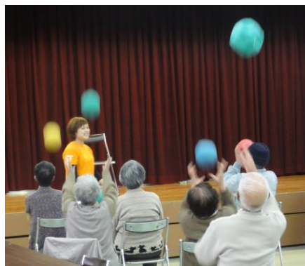
体操に夢中な高齢者

しかし、食品衛生に対する意識が高くなってきた昨今の社会の変容に伴い、現在では畑賀福祉センターで毎月一回の会食という形に変わり、一人暮らし高齢者の外出機会を促すことにつながっています。また、当サロンでは、ケアハウス安芸中野に通われる高齢者も参加され、地域の高齢者とのふれあいの場となっています。