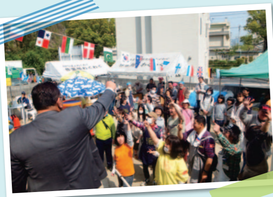
▲作業所まつりでのじゃんけん大会の様子

中国銀行 広島西支店様より、地域への社会貢献活動としてサッカーの観戦チケット提供の申し出がありました。店舗の近隣地域を中心に提供先の調整を行い、地域や作業所行事での景品等として活用されることになりました。