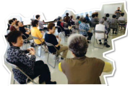
▲サロン活動の様子

地域福祉推進委員になって14年になります。はじめたきっかけは、当時の地区社協会長からの推薦がきっかけです。就任した当初は、どういった活動をするのか何も分からない状態でしたが、推薦いただいたからにはしっかりやりきる気持ちで始めました。