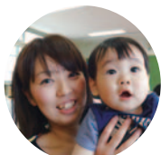
▲男の子(11ヶ月)とお母さん

取材に伺った5月20日は中保健センターから栄養士が来られ、「楽しく食べる子ども」と題して、遊び食いや好き嫌いなどについてのお話がありました。子育て中のお母さんにとって子どもの食事はやはり関心事なので、皆さん真剣に聞かれていました。また、そのお母さんの様子を見て真似をしたのか、じっと栄養士を見つめる子どもたちが印象的でした。