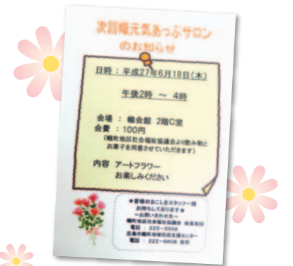
▲お手製の案内チラシ

特にコツはありませんが、やりがいのある活動なので引き受けたからには、一生懸命取り組みたいです。