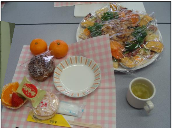
クリスマスオードブルおいしかったよ☆