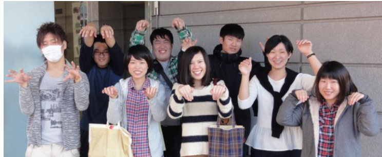
ヤンボラメンバーです(^O^) 妖怪体操頑張ったよ(^)