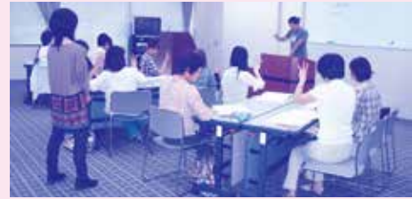
▲平成24年手話ボランティア入門講座の様子