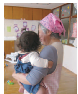
しっかりと抱んだ子どもの手から温もりが伝わります。

・子どものプライバシー保護のため、活動中のことは他言しないという約束をしています