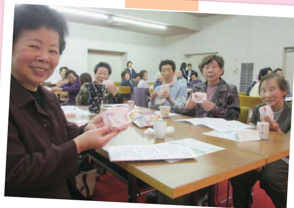
原町借り上げ住宅サロン(原町福祉会館)の皆さまの様子。東北にも多くの笑顔の輪が広がりました。

南相馬市社会福祉協議会からお礼とサロンの皆様の写真が届きましたので、ご報告させていただきます。