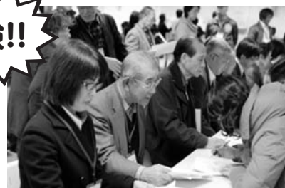
ボランティア要望の受付班