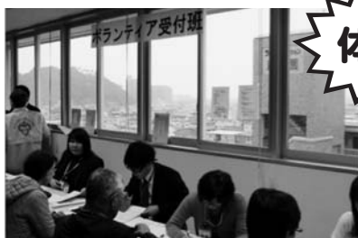
ボランティアの受付班