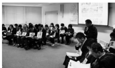
災害ボランティアセンターが 開設されるまでの寸劇

当日は地(学)区社会福祉協議会、民生委員、ボランティア、公民館、地域包括支援センターから約80名が参加され、災害ボランティアのDVDを見たり、実際に「災害ボランティアセンター」へ相談に行くなどの体験をしました。