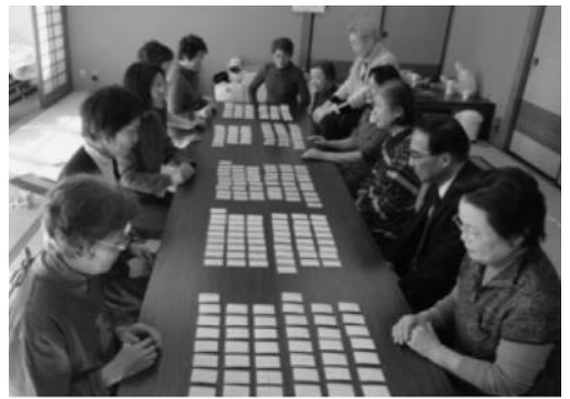
「ちはやふる～」みなさん札に集中!

これからは、体力も衰えていくため、行事に追われることのないように、今のつながりをどのようにもっていくか、課題もありますが、関係機関とも連携して、みんなで話し合いながら、取り組んでいきたいと思っています。