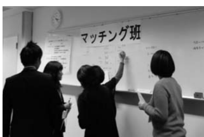
ボランティアとボランティア要望の調整班