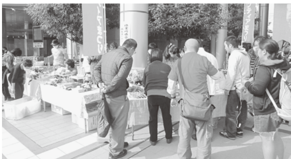
作業所の製品販売や、バザーも開催します!掘り出し物はあるかな?