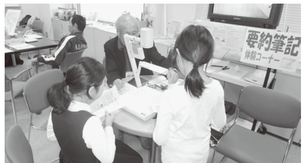
福祉体験コーナー的一幕。要約筆記に挑戦中♪