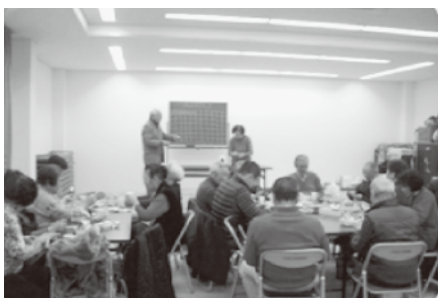
高齢者いきいきサロン