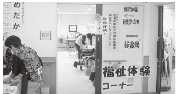
様々な福祉体験ができます♪気軽にご参加ください!