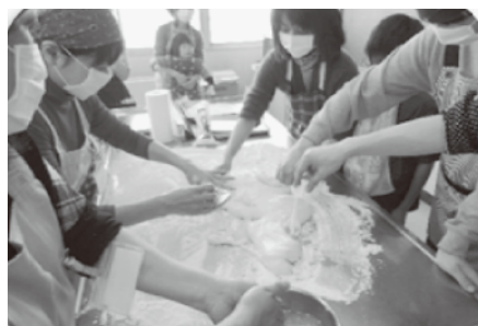
障がいをもつ子どもたちの交流会