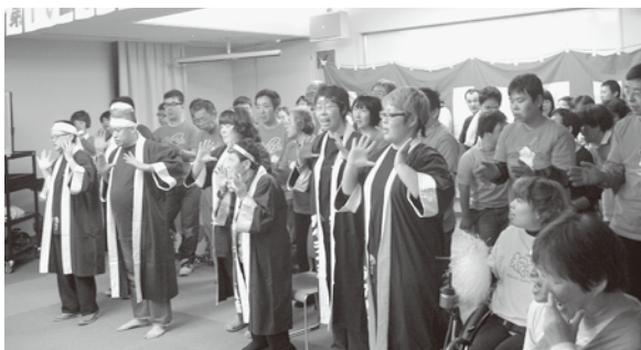
歌や踊りなど、多彩なステージ発表に会場も大賑わい!