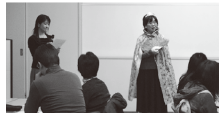
あび隊講座の一場面

*FAXまたはEメールでお申し込みの際には、「知的障がい公開講座申込」と記入の上、名前・住所・連絡先をお願いします