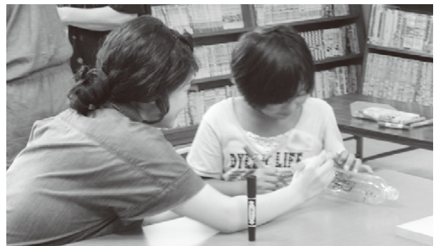
児童館での一場面「子どもと一緒に工作♪」