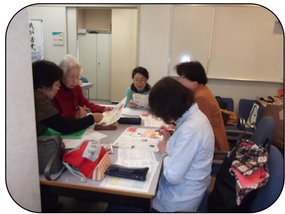
<デジタイズ録音勉強会の様子 あか音の会>