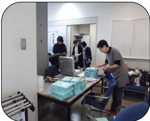
<テープ整理の様子 みずきの会>

録音したものをパソコンで編集、出来上がった CD をコピー、ひとつひとつの段階でトラブルが発生し右往左往していますが、ボランティアさんの努力で5月に CD を発送することができました。発送後も新たなトラブルに直面していますが、そのつど解決に向けて努力しています。ボランティアのみなさまの努力に心からエールを送ります。