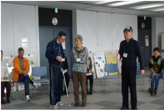
手引きのやり方の説明を受けています

昨年の交流会で好評だった“ボランティアグループの活動体験！”を今年もボランティアさんの希望で同様の交流会を行ないました。今回の活動体験は、ガイドサークルむつみ会によるアイマスク体験、広島市要約筆記サークルおりづる安佐南支部による要約筆記体験、保健福祉課保健師の指導による健康体操、ティータイムには、アイマスクを付けて、お茶とクッキーを食べてみるなど盛りだくさんの体験でした。最後に、‘花は咲く’を全員で合唱しました。