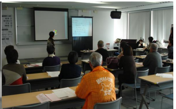
“速く・正しく・読みやすく” 内容を要約します