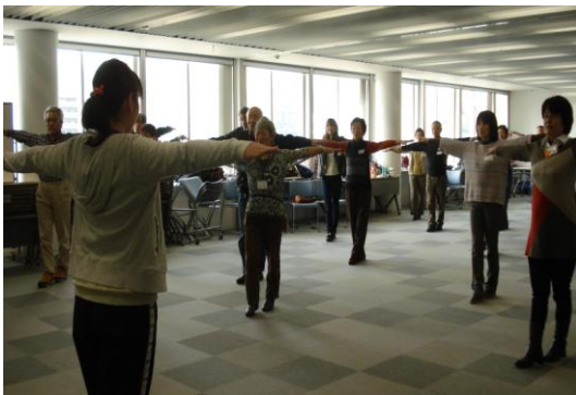
“ひろしまじゃけん体操” やってます！