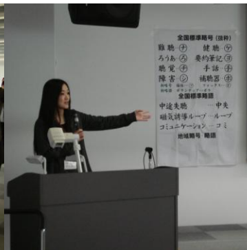
要約筆記についての説明