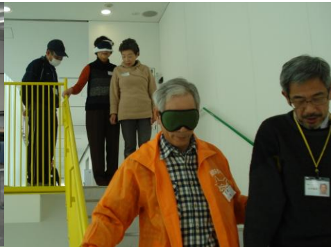
アイマスク体験中ちょっと怖そう！