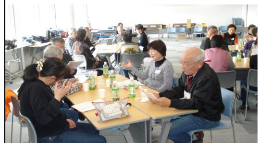
手話を交えての合唱♥交流会らしいですね