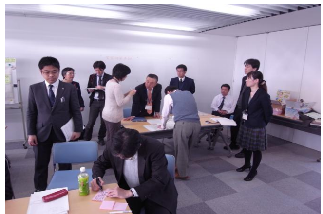
(総務班・ニーズ把握班・ボランティア受付・マッチング班に分かれ実際にスタッフ、ボランティア、住民の役を体験する様子)