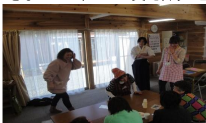
ボランティアによるレクリエーション

原発の必要性、子どもが受けている偏見、常日頃からの地域のつながりの大切さなど、これからしっかり向き合わなければいけない問題もたくさんあることを知りました。こうやって見ていくと、「今回は、福島でこのようなことが起こったが、いつどこで起こるかはわからない。今支援している側にいる人も、支援される側になるということを忘れてないで」という言葉は、全て人の心に留めてほしい言葉だと思いました。また、常日頃からの地域でのコミュニケーションが取れていなかったばかりに助かる命も助けられなかったと聞くと、いかに一人で生きることなどできないのか、いかに支え合うことが大切かを感じました。