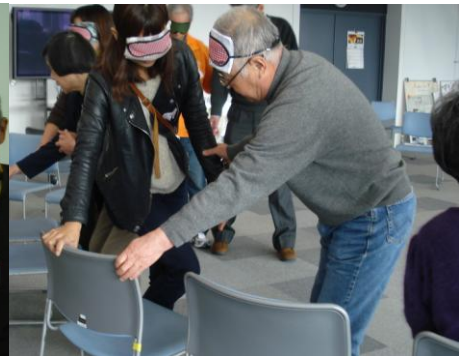
声掛けしながら椅子への介助