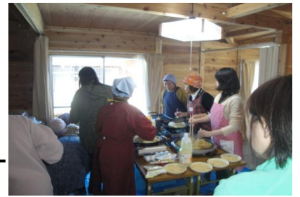
広島風お好み焼きを焼いています

広島市被災者支援本部が募集した土日お茶会サロンに2月・3月に参加し安佐南区災害ボランティアセンター設立・運営シミュレーションにも参加した学生に感想・気づきを聞いてみました。