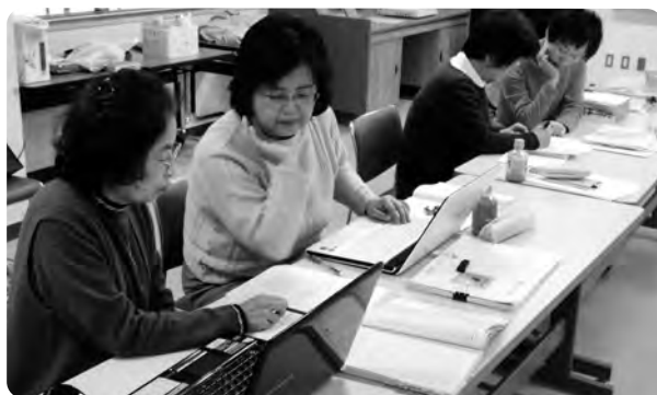
定例会での点訳作業の様子

現在のメンバーは13名ですが、点訳依頼の増加に伴い負担が大きくなっています。会の構成年齢も高まっており、新たなメンバーを募って活動を継続することで、今後も多くの方々に情報を届けるお手伝いをしていきたいと考えています。