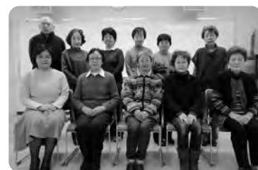
点字サークル楽点会の皆さん

このたびの表彰については「活動継続に対する評価」ととらえており、これは他のボランティアグループの方々の励みにもなるのでは?とのことでした。負担は増えつつあるものの、メンバーが自然体で楽しみながら活動に取り組み、その結果、長年にわたり情報のつなぎ役として多くの方々を支えているという状況は、ボランティア活動の好例と言えるのではないのでしょうか。