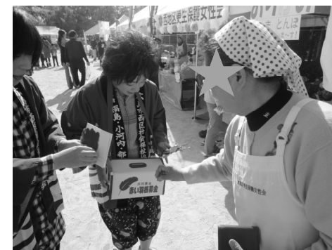
募金活動の様子(11月4日)

ボランティア講座をきっかけに、中学1年の娘と今回初めてボランティアまつりに参加し、赤い羽根共同募金の活動をさせていただきました。いつもはその姿を見ている立場でしたので、いざ自分がするとなると要領がわからず、とりあえず活動していることがわかるよう、大きな声で呼びかけをしました。「お疲れ様、頑張ってるね!」と優しい声をかけていただきながら楽しく活動することができ、おかげ様で小さなお子さんから年配の方までたくさんの方々にご協力いただき、心から感謝しております。