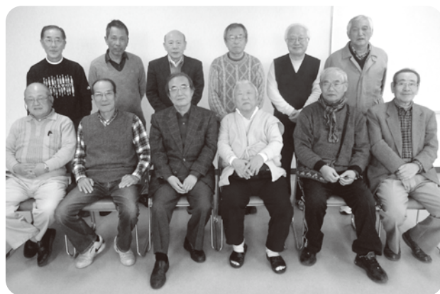
「男のつどい」のみなさん