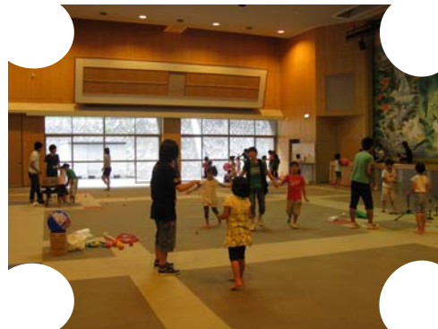
汗びっしょりになって遊びました。

天候には恵まれませんでしたが、子どもたちはお姉さんやお兄さんたちと遊び、楽しく過ごしていました。参加した学生さんも子供たちと走り回ってしっかり汗を流していました。相手に伝えたい気持ちを分かりやすく話したり、一緒に行動することで、楽しくコミュニケーションが取れることに気づき、積極的に子供たちと触れ合えた学生たちの声が聞かれました。ボランティアが少しでも身近で楽しく感じ、次の活動や暖かい人間観につながればと思います。