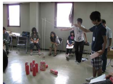
ただ今、遊び方を勉強中。