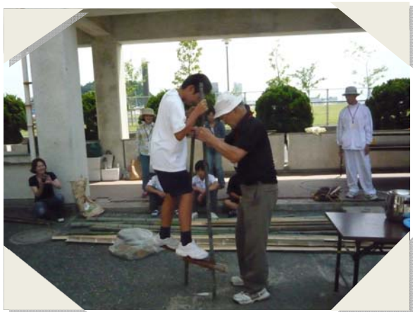
竹馬に初チャレンジ。