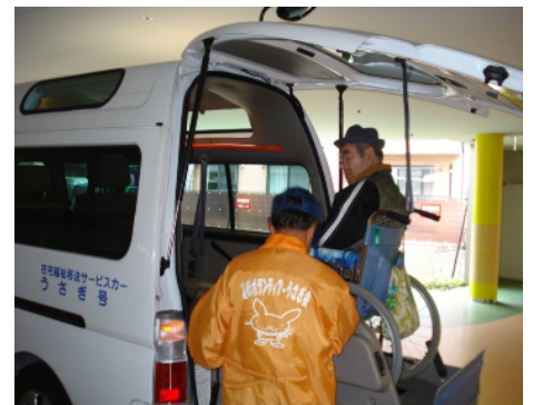
うさぎ号利用の様子

運転ボランティア「うさぎ会」が出来た経緯は、平成2年に「車いすにのったまま外出できるリフト付き車両を自分たちで運行したい。」という思いを持っていた障害青年の会「在宅障害者福祉研究会」が、24時間テレビのリフト付き車両の寄贈を申請し、その夢が叶えられて「広島ハンディホイラーを走らせる会」を組織し、新聞で運転者をボランティア募集してリフト付き車両「うさぎ号」を走らせました。