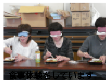
食事体験をしています