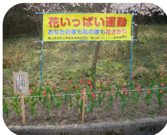
記：ボランティアコーディネーター